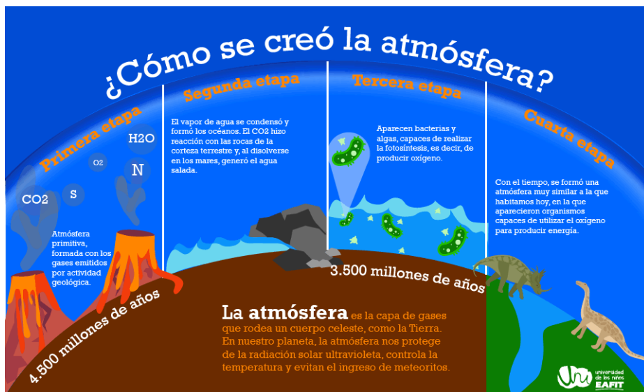
Gases de la atmósfera

Lavoisier, hombre entregado al progreso de la ciencia, fue condenado a muerte y ejecutado en una revolución. Sin embargo, quedó establecida la presencia en el aire del nitrógeno, argón, ácido carbónico, vapor de agua e innumerables corpúsculos orgánicos, es decir, los elementos indispensables para toda forma de vida.