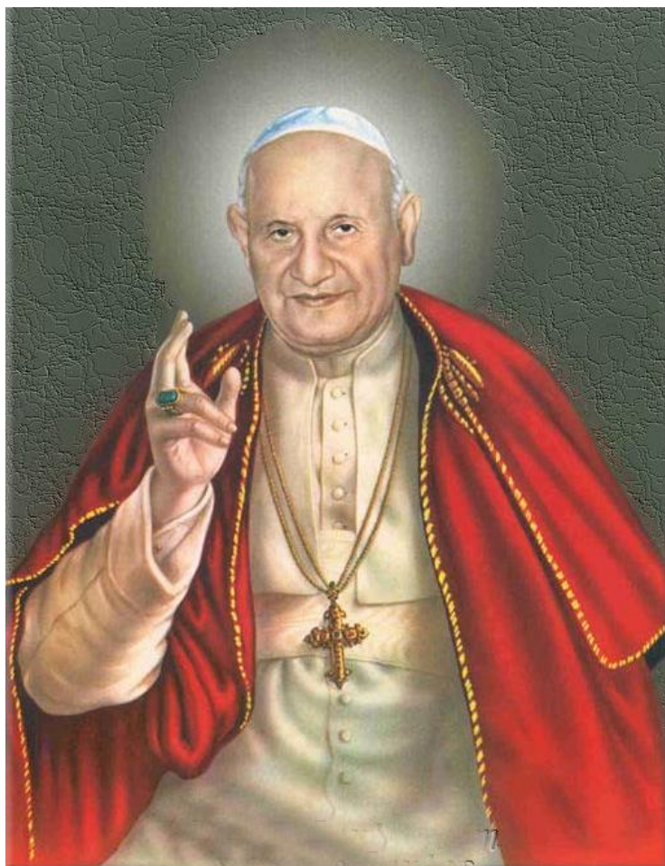
Monseñor Roncalli (Juan XXIII) El Papa bueno. (Angelo Giuseppe Roncalli): Sotto il Monte (Bérgamo): Octubre 28 (Noviembre 4), 1958 - Junio 3, 1963.

reconocimiento de Monseñor Roncalli (posteriormente Juan XXIII) es realmente importantísimo y debería ser reproducido en todas partes con el objeto de dar a cada ser humano el derecho de tener sus aspiraciones individuales. En fin, es una prueba de Tolerancia que debería ser reconocida por todos los clérigos, ya que la suprema autoridad de la religión lo aconseja y confirma (los discípulos no pueden ser más que su Maestro...).