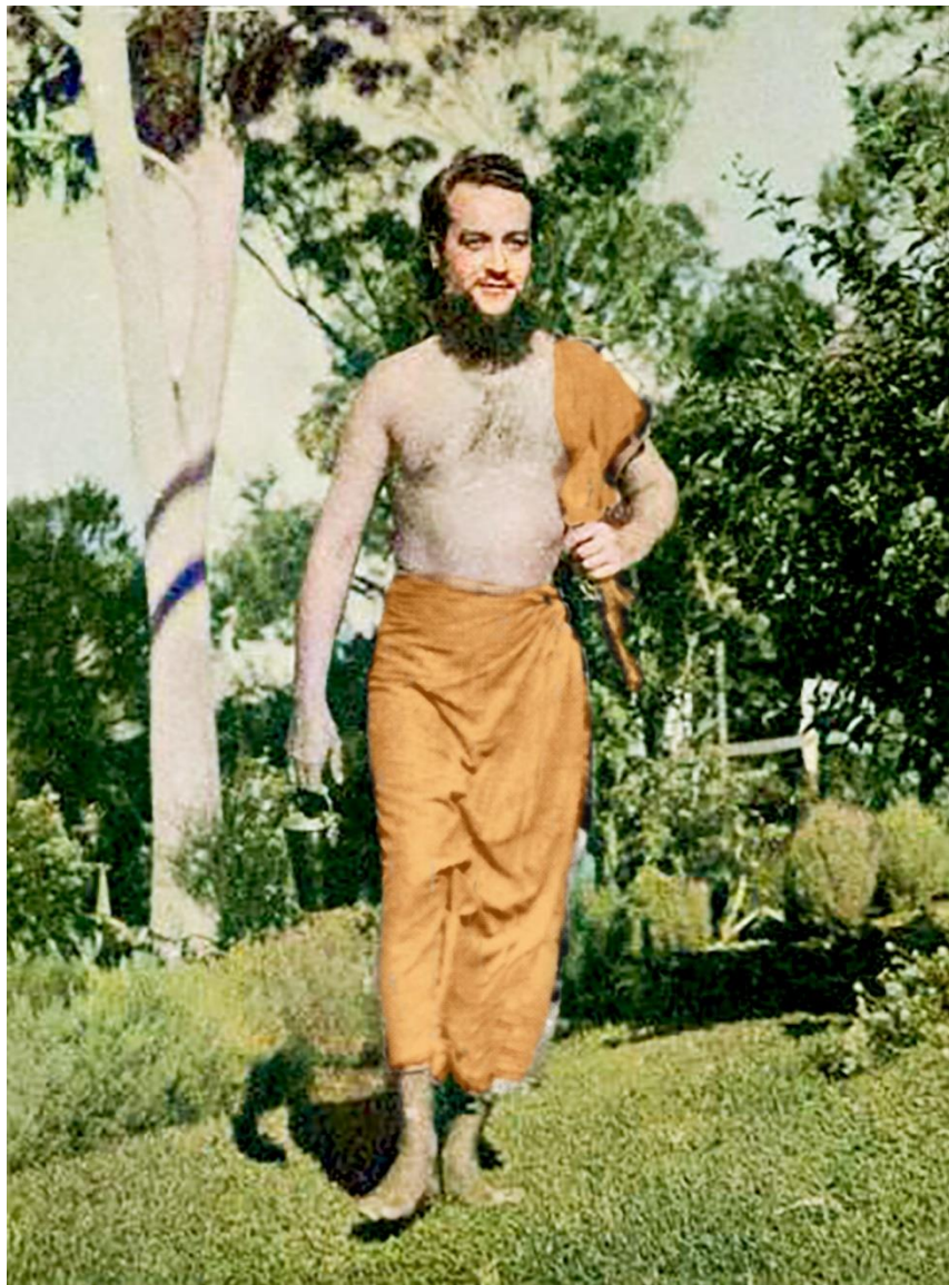
EL MAHĀTMA CANDRA BĀLA En camino de peregrinaje. Un Samnyāsin tiene únicamente por todo equipaje su pequeño recipiente o lōtha y su guerrúa como vestido (dos pedazos de tela color azafrán).