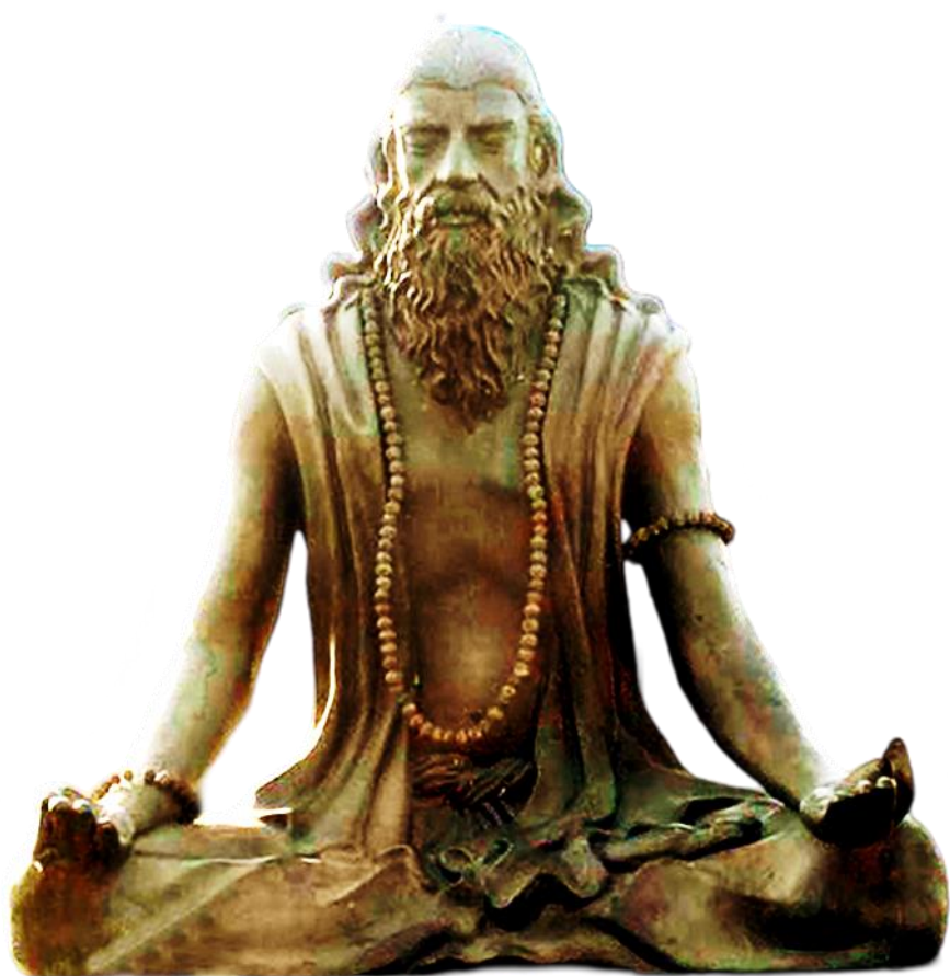
Imagen de Patāñjalī. Se cree que el sabio Patāñjalī es una encarnación de Ādiśeṣa, una serpiente de mil cabezas. Generalmente, el número mil representa el infinito en las escrituras antiguas. La serpiente es un símbolo de fuerza.

Patāñjalī es considerado un sabio con fuerza y conocimiento ilimitados. El mantra Yōgēna cittasya es la invocación de todos sus poderes. Debido a sus poderes, se cree que Patāñjalī vivió ocho siglos. Fue conocido por codificar los Yoga Sūtras, de los cuales se deriva la práctica moderna del yoga. La obra de Patāñjalī se encuentra en unos 200 aforismos de los Yoga Sūtras.